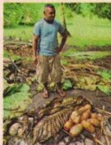
lovo 石爐 Lovo乃一種石爐,以熱石炙熟食物。

斐濟是個有逾300個島嶼的島國,可是很多遊客,都只踏足旅遊重鎮楠迪(Nadi,音「Nandi」)所在的最大島嶼維提島(Viti Levu)。想體驗更多,就要走出維提島。