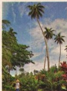
超高椰樹 度假村裏的椰子樹,長得有約三層樓那麼高。