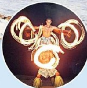
▲波利尼西亞的民族舞蹈，有多火辣？有圖為證。