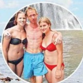
▲這班歐洲青年打算環遊世界半年，覺得斐濟最棒，逗留一個月還未夠，說要多留半個月。