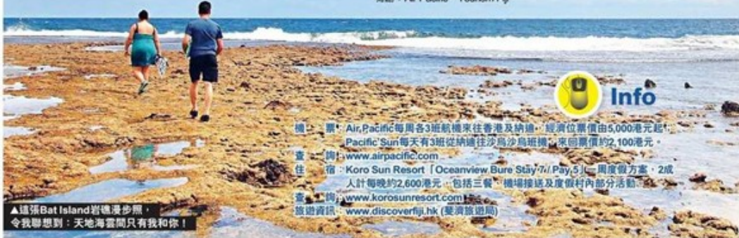
▲這張Bat Island岩礁漫步照，令我聯想到：天地海雲間只有我和你！