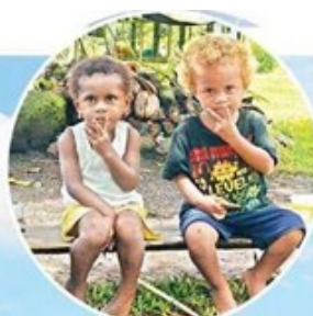
▲Vuadomo村民都很友善，小朋友都任嘍囉。